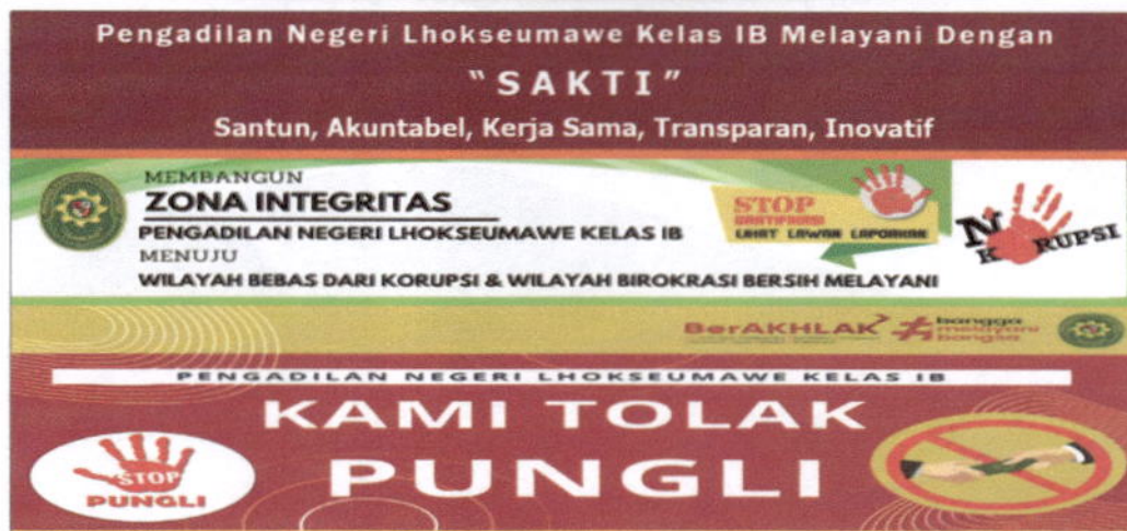
Gambar 1. Website Pengadilan Negeri Lhokseumawe Kelas IB

Secara umum informasi yang telah ditampilkan di website Pengadilan Negeri Lhokseumawe telah mengikuti pedoman rancangan dan prinsip aksesibilitas website Pengadilan di Lingkungan Mahkamah Agung dimana pada struktur menunya terdiri dari :